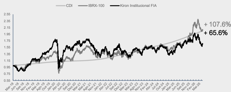
GRÁFICO DA PERFORMANCE

Obs: Histórico de rentabilidade em R$, líquido de taxas. Cálculo de volatilidade apenas para dias de pregão. *Início do fundo: 22/03/2018