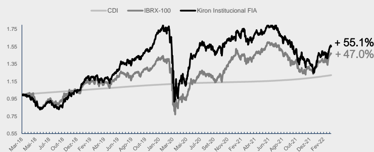
GRÁFICO DA PERFORMANCE