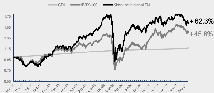
GRÁFICO DA PERFORMANCE