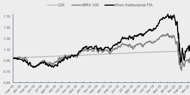
GRÁFICO DA PERFORMANCE