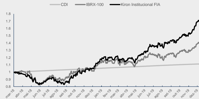
GRÁFICO DA PERFORMANCE