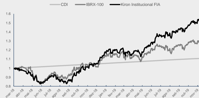
GRÁFICO DA PERFORMANCE