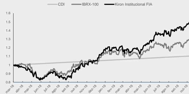
GRÁFICO DA PERFORMANCE