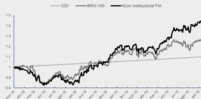
GRÁFICO DA PERFORMANCE