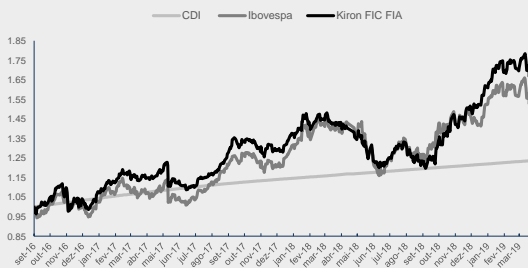
GRÁFICO DA PERFORMANCE KIRON II FIC FIA