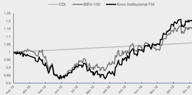
GRÁFICO DA PERFORMANCE