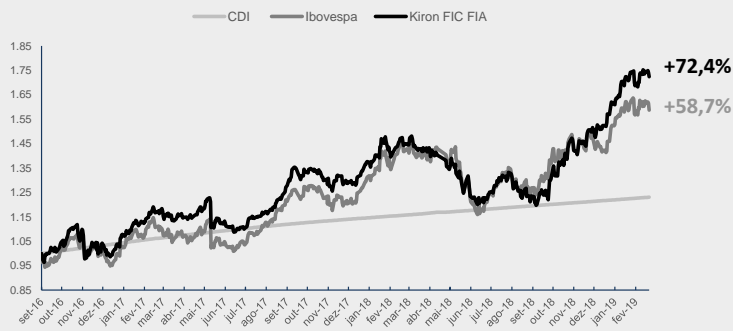
GRÁFICO DA PERFORMANCE