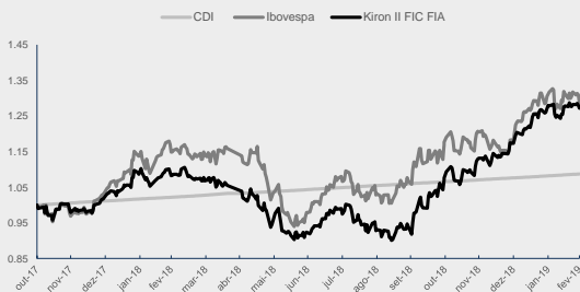
GRÁFICO DA PERFORMANCE INSTITUCIONAL FIA