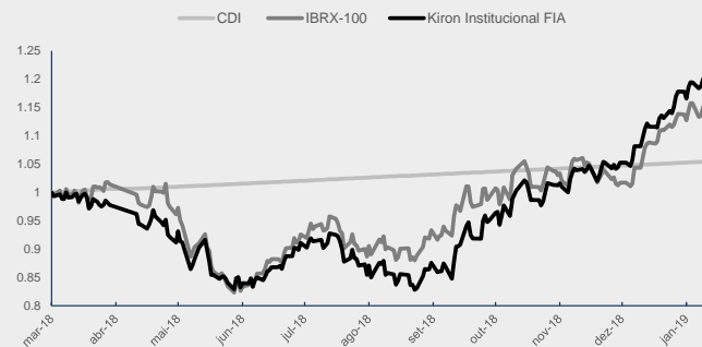
GRÁFICO DA PERFORMANCE