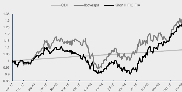
GRÁFICO DA PERFORMANCE