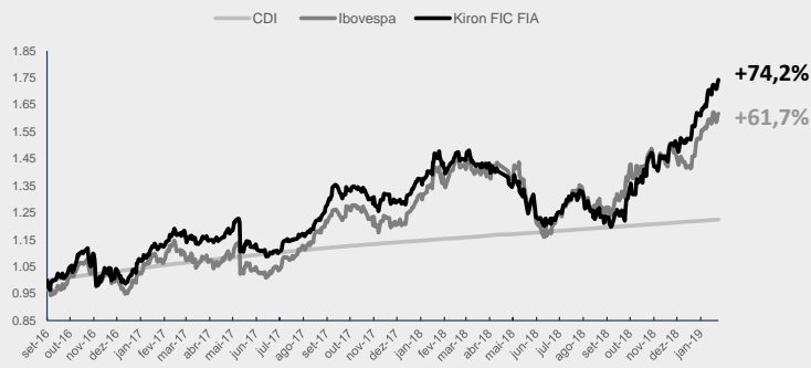
GRÁFICO DA PERFORMANCE