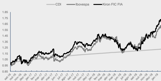
GRÁFICO DA PERFORMANCE KIRON II FIC FIA