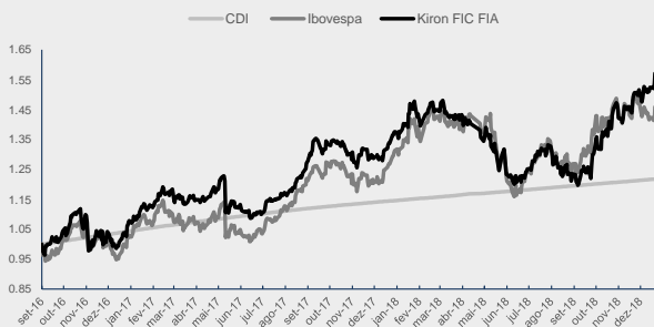
GRÁFICO DA PERFORMANCE KIRON II FIC FIA