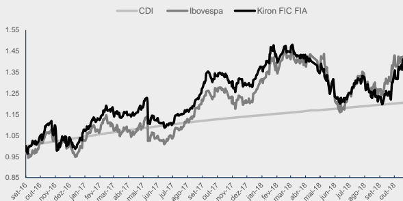
GRÁFICO DA PERFORMANCE KIRON II FIC FIA