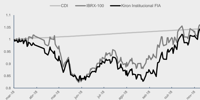
GRÁFICO DA PERFORMANCE

Obs: Histórico de rentabilidade em R$, líquido de taxas. Cálculo de volatilidade apenas para dias de pregão. *Início do fundo: 08/09/2016