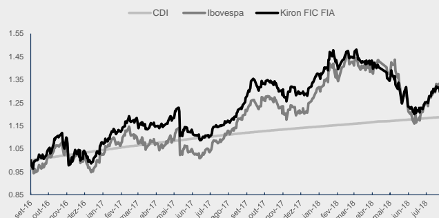
GRÁFICO DA PERFORMANCE

Obs: Histórico de rentabilidade em R$, líquido de taxas. Cálculo de volatilidade apenas para dias de pregão. *Início do fundo: 08/09/2016